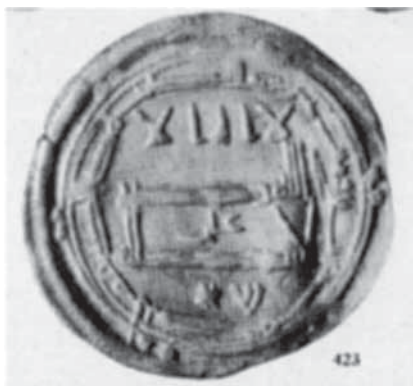
Fig. 11. Anverso de la pieza Eustache Idr. 423, Lámina XXV

alef , sea la inicial del término Elohim , que designa a Dios; bien que se trate de la inicial del nombre propio de un líder tribal que acuñara moneda, como pudo ser Abi‘ezer (אביעזר) o אידיר, nombre bereber documentado ya por las fuentes árabes en el siglo IV/X, y que llevó el líder de una tribu Zanata de los Toujīn, Yedder Ibn Loqman; o bien que se tratara sencillamente del signo del artesano judío que abriera el cuño monetal 43 . En cuanto a la letra šin , figura en emisiones de la ceca de Īkam del año 204/819-820 ( Eustache 423) (Fig. 11), también atribuidas a Idrīs II 44 . Ésta, bien pudo representar un número, como propuso Eustache 45 . Aunque también pudo hacer referencia bien a la Divinidad, al ser inicial de algunas de sus cualidades ( Šalom —paz—, Šadday —Omnipotente, Todopoderoso—) o del término Šekina , que hace referencia a la presencia sin límites de Dios junto a los hombres, o de la misma profesión de fe judía ( šema Israel ); o bien pudo tener un carácter político siendo el signo del representante tribal (si se tratara de la inicial de šeliaj ) o siendo la referencia al acuerdo político entre la tribu e Idrīs II al que estaría sujeta la emisión (de tratarse de la palabra šetar , “acta, contrato”) 46 .