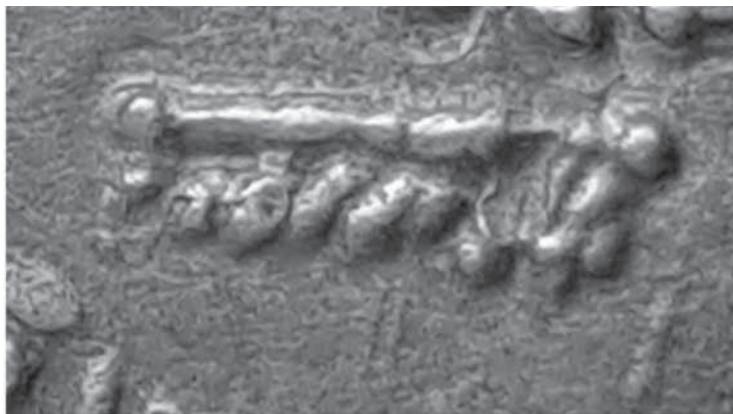
Fig. 8. Detalle de la inscripción hebrea.

La aparición de una inscripción en hebreo, aunque inédita hasta la fecha para el período del califato andalusí no lo es, en general, para la moneda islámica. En el caso del occidente islámico, el primer testimonio se remonta a las primeras emisiones peninsulares, a los denominados sólidos o dinares “transicionales”, contando en la actualidad con dos ejemplares cuyas leyendas centrales están escritas en hebreo. El primero de ellos es un dinar conservado en el Museo Arqueológico Nacional de Madrid (MAN 2004/117/11) (Fig. 9), y el segundo pertenece a la colección del Bode Museum de Berlín (ref. 18236214) (Fig. 10).