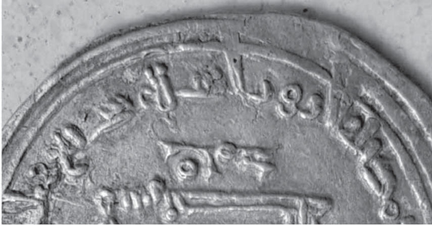
Fig. 7. Detalle del nombre de la ceca

Por último, si nos fijamos con detalle en el final del nombre de ceca, nos encontramos ante un defecto de cuño, similar al que aparece en la sin del numeral saba 'a, siendo lo que pudiera parecer un 'alif y una lām sencillamente un 'alif mal grabado o con doble golpe de cuño (Fig. 7).