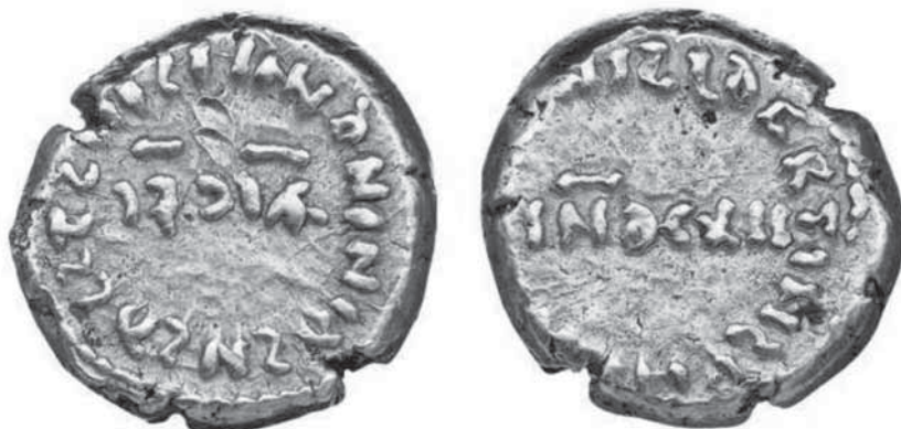
Fig. 10. Ejemplar 18236214 del Bode Museum de Berlín.