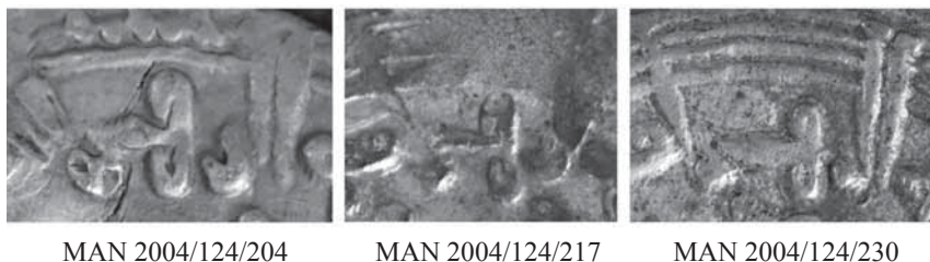
Fig. 2. Detalle de la grafía \text{ح} en el nombre de ceca. Tipo 1.

Raḥmān III de Madīnat al-Zahrā', momento que “hubo de suponer un cambio con respecto a la situación anterior” como ponen de manifiesto la aparición del título de Imām y el laqab del califa en su epigrafía fundacional, coincidiendo con un momento de controversia religiosa que se materializará este mismo año 340/951-952 con el inicio de la persecución de los masarries 6 . Por lo tanto, el cambio caligráfico en la representación del nombre de al-Zahrā' bien podría responder a este significativo cambio que tuvo lugar. Es decir, coincidiendo con la construcción del principal espacio del poder califal se utilizará una nueva grafía para el nombre de al-Zahrā' que superará la representación tradicional de la hā' llevada a cabo en las emisiones del emirato (tipo 1).