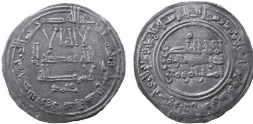
Fig. 1. Dirham, Madīnat al-Zahrā' , 337/948-949. Colección González Bermúdez

En la I.A. a la izquierda de la leyenda central y en disposición vertical figura un texto en caracteres hebreos, para cuya lectura propongo la expresión \text{אמן וכן} como expondré más adelante. Sobre la leyenda central de la II.A. figura un anillo o pequeño círculo.