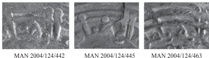
Fig. 3. Detalle de la grafía \text{ح} en el nombre de ceca. Tipo 2.