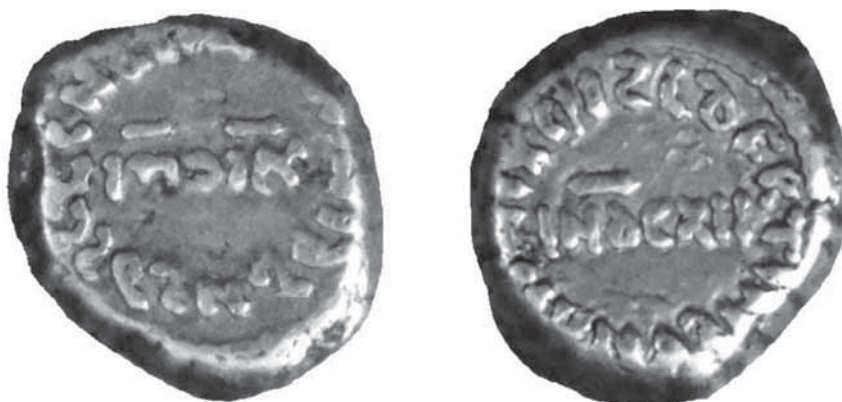
Fig. 9. Ejemplar 2004/117/11 del Museo Arqueológico Nacional de Madrid.

fecha de indicción, como tampoco tratarse de una deformación de la palabra "SIMILIS". Por todo ello, y dado que aparecen caracteres hebreos en otras monedas islámicas, coincido con Delgado, Vázquez Queipo, quizá Codera tras la publicación de su citada obra 29 , Longpérier y recientemente Bar-Magen, como vamos a ver, en que debe tratarse de caracteres hebreos.